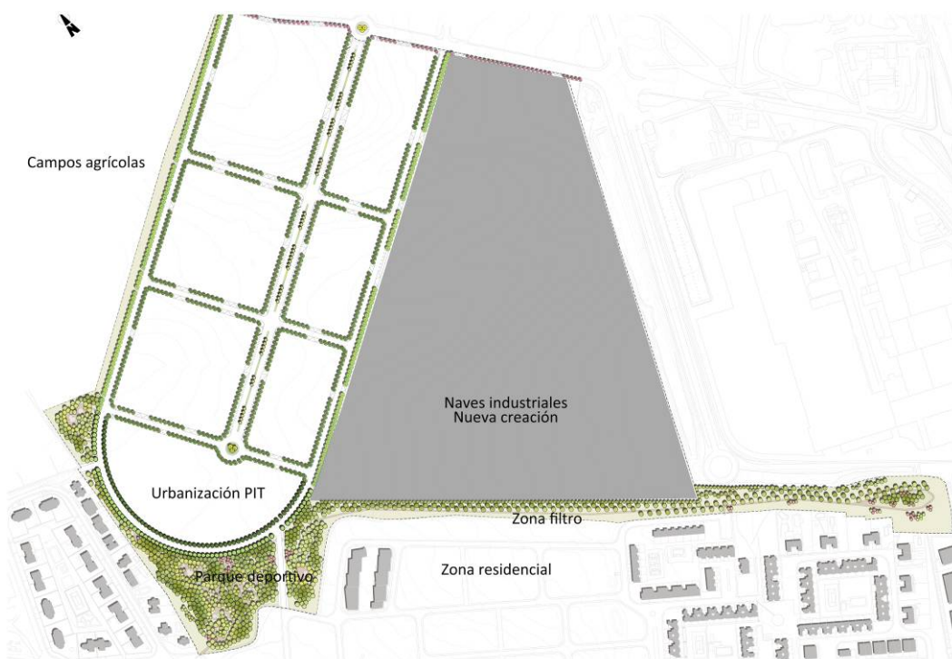
Figura 3.- Planta General del proyecto de zonas verdes.

El parque pretende servir para el recreo y ocio tanto de los empleados de la zona industrial como de los vecinos de la residencial. Por ello se estructuró en una serie de caminos peatonales que conectaban con pequeñas zonas estanciales, que se dotaron de equipamientos de tipo deportivo, bancos y áreas de descanso. Se aprovecharon las tierras excedentarias de la urbanización para crear, mediante la modelación del terreno, una microtopografía que generara vistas más o menos abiertas a lo largo del recorrido de los caminos.