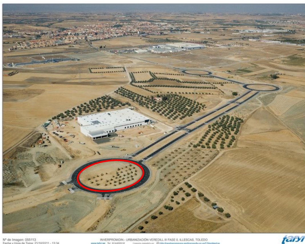
Figura 6.- Fotografía aérea. Caso 2 de estudio.

La glorieta tiene una superficie de casi 6.000 m 2 y en la mitad de su superficie se han trasplantado olivos procedentes de parcelas próximas.