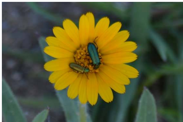
Figura 11.- Insectos de la familia Melyridae sobre Calendula arvensis dentro de la glorieta