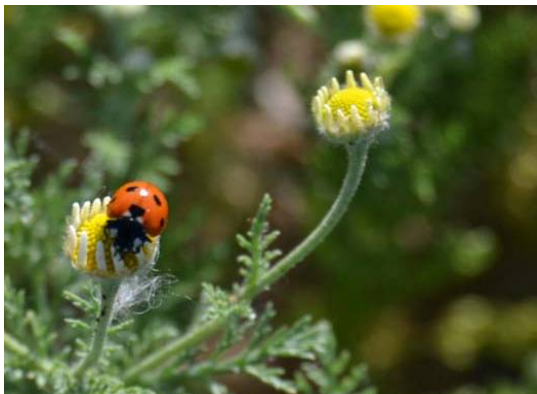
Figura 10.- Coccinella septempunctata sobre Matricaria arvensis dentro de la glorieta