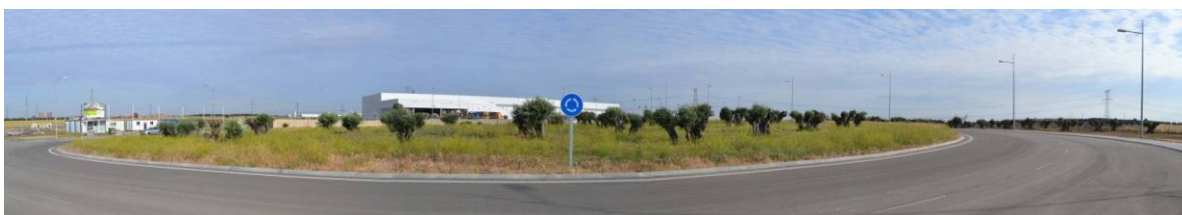
Figura 9.- Vista general de la rotonda, al fondo a la derecha olivar colindante. El color que domina es el amarillo de Calendula y Diplotaxis (mayo de 2014).

En segundo lugar destaca la falta de las leguminosas y gramíneas aportadas en la mezcla de 2013, dominando las especies de flor. La presencia de algunas especies procedentes de la mezcla anterior nos hace pensar en que la causa pueda deberse a una excesiva movilización del terreno o a una siembra demasiado profunda de la mezcla utilizada para esta campaña, que habrían permitido la germinación de especies existentes en el suelo y no las aportadas en 2013. Sin embargo, la coincidencia de muchas de estas especies de flor en ambas mezclas no nos deja concluir que así haya sido. Otra explicación podría ser, como ya se ha indicado, que la siembra se haya realizado demasiado tarde, favoreciendo a unas especies en detrimento de otras.