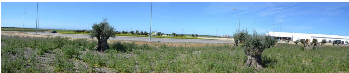
Figura 8.- Vista del olivar colindante a la rotonda (al fondo) en el que dominan casi exclusivamente el cardo ( Carduus bourgeanus ) (mayo 2014).